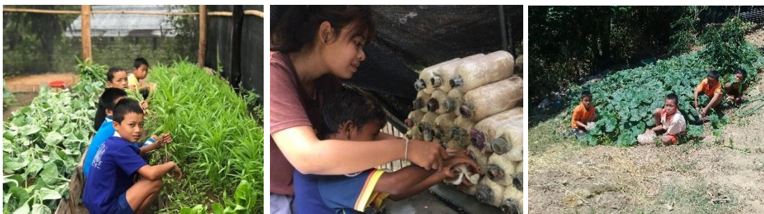
ภาพประกอบเป้าหมายที่ ๔.๑ เด็กและเยาวชนมีความรู้และทักษะพื้นฐานทางการเกษตรยั่งยืนในการผลิตอาหารเพื่อการบริโภค

เป้าหมายที่ ๔.๑ เด็กและเยาวชนมีความรู้และทักษะพื้นฐานทางการเกษตรยั่งยืน ในการผลิตอาหารเพื่อการบริโภค