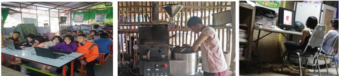
ภาพประกอบเป้าหมายที่ ๓.๒ เด็กและเยาวชนมีทักษะด้านเทคโนโลยีสารสนเทศ