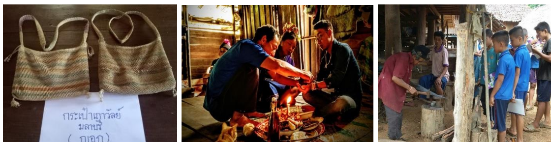
ภาพประกอบเป้าหมายที่ ๖.๑ เด็กและเยาวชน มีความภาคภูมิใจ เห็นคุณค่าในมรดกทางวัฒนธรรมและภูมิปัญญา