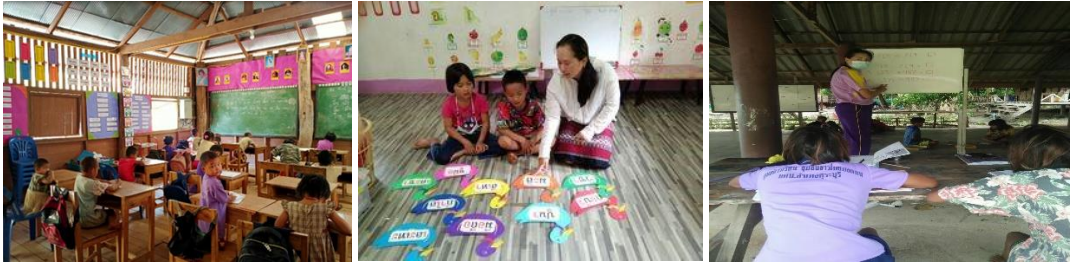
ภาพประกอบเป้าหมายที่ ๒.๑ เด็กที่ขาดโอกาสสามารถเข้าถึงบริการทางการศึกษาและการพัฒนาเพิ่มขึ้น

เป้าหมายที่ ๒.๑ เด็กที่ขาดโอกาสสามารถเข้าถึงบริการทางการศึกษาและการพัฒนาเพิ่มขึ้น