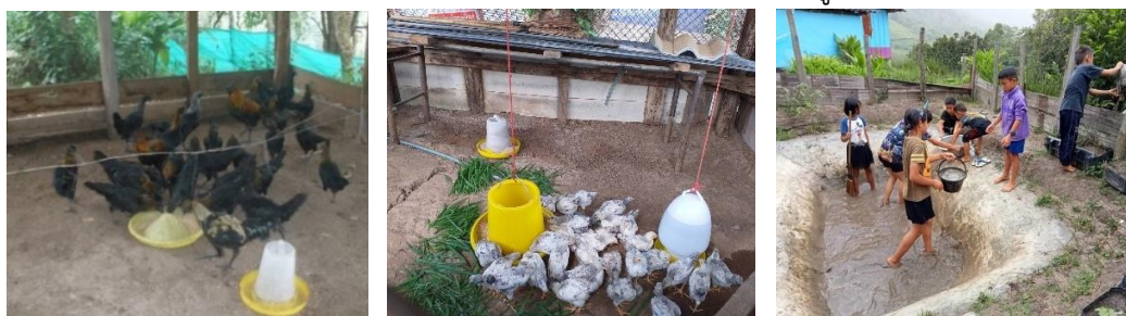
ภาพประกอบเป้าหมายที่ ๗.๑ การนำกิจกรรมการผลิตทางการเกษตรในโรงเรียนมาสู่การผลิตอาหารในระดับครัวเรือน