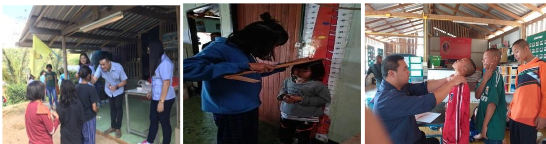
ภาพประกอบเป้าหมายที่ ๑.๓ เด็กและเยาวชนมีน้ำหนักและส่วนสูงตามเกณฑ์มาตรฐานเพิ่มขึ้น และมีพฤติกรรมสุขภาพที่เหมาะสม

เป้าหมายที่ ๑.๓ เด็กและเยาวชนมีน้ำหนักและส่วนสูงตามเกณฑ์มาตรฐานเพิ่มขึ้น และพฤติกรรมสุขภาพที่เหมาะสม