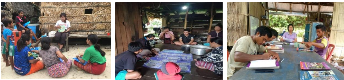
ภาพประกอบเป้าหมายที่ ๘.๒ ครูและเด็กนักเรียนสามารถถ่ายทอดความรู้โดยการเป็นวิทยากร

เป้าหมายที่ ๘.๒ ครูและเด็กนักเรียนสามารถถ่ายทอดความรู้โดยการเป็นวิทยากร