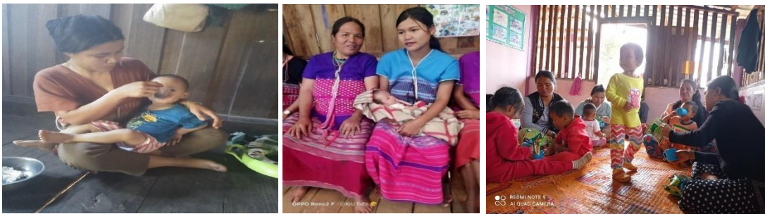
ภาพประกอบเป้าหมายที่ ๑.๑ หญิงตั้งครรภ์ มารดาหลังคลอด และทารก ได้รับบริการที่มีคุณภาพ

เป้าหมายที่ ๑.๑ หญิงตั้งครรภ์ มารดาหลังคลอด และทารก ได้รับบริการที่มีคุณภาพ