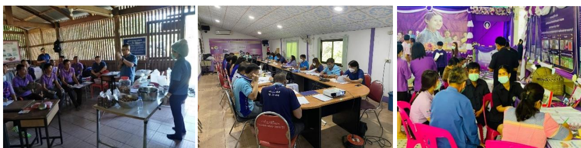
ภาพประกอบเป้าหมายที่ ๓.๔ ครูมีการพัฒนาตนเองอย่างต่อเนื่อง