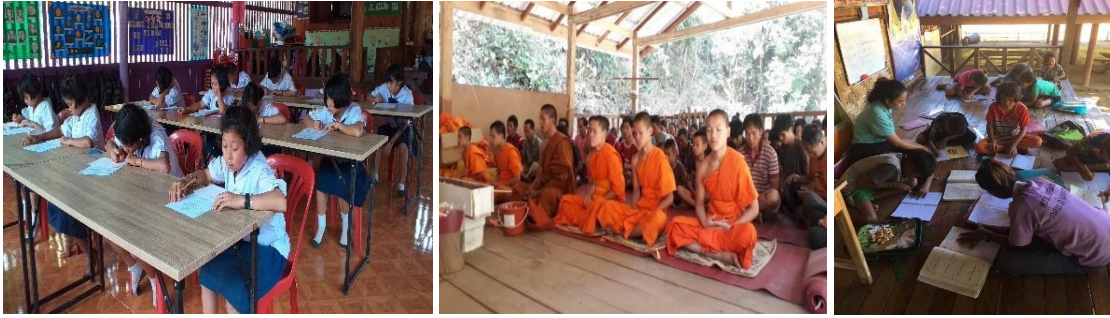
ภาพประกอบเป้าหมายที่ ๓.๑ เด็กและเยาวชน มีผลสัมฤทธิ์ทางการเรียนในวิชาภาษาไทย คณิตศาสตร์ วิทยาศาสตร์ ภาษาอังกฤษ และสังคมศึกษา ศาสนา และวัฒนธรรมสูงขึ้น