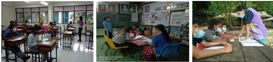
ภาพประกอบเป้าหมายที่ ๓.๓ เด็กและเยาวชนได้รับการเตรียมความพร้อมสำหรับประชาคมอาเซียน