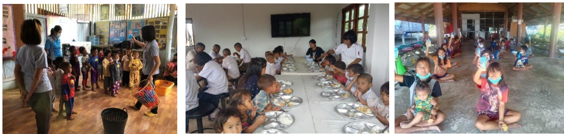
ภาพประกอบเป้าหมายที่ ๑.๒ เด็กทุกช่วงอายุได้รับการส่งเสริมด้านโภชนาการและมีพัฒนาการตามวัย

ที่มา : รายงานผลการดำเนินงานโครงการ ฯ สำนักงาน กศน. จังหวัดน่าน พังงา