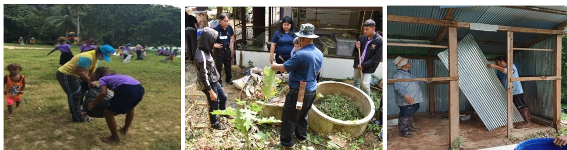
ภาพประกอบเป้าหมายที่ ๗.๒ เด็กและเยาวชน และสมาชิกในครอบครัวมีการปรับเปลี่ยนพฤติกรรมสุขภาพ

เป้าหมายที่ ๗.๒ เด็กและเยาวชน และสมาชิกในครอบครัวมีการปรับเปลี่ยนพฤติกรรม สุขภาพและร่วมกันพัฒนาสภาพแวดล้อมของบ้านและชุมชนให้ถูกสุขลักษณะ