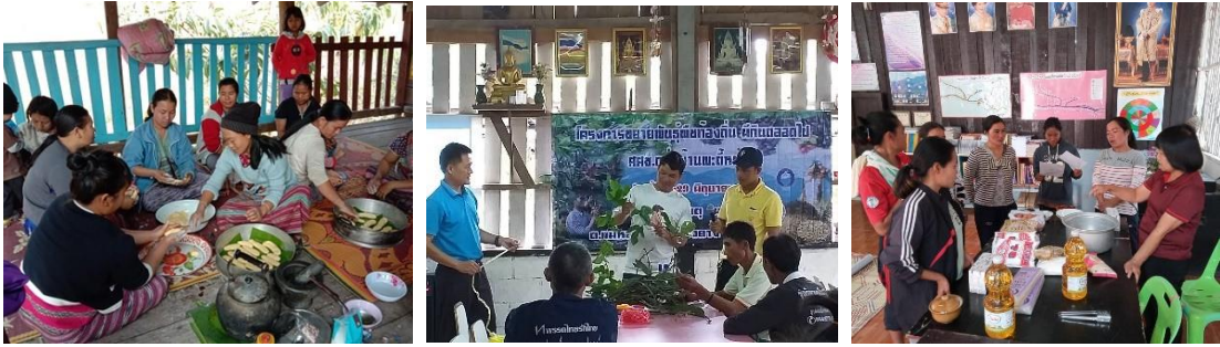
ภาพประกอบเป้าหมายที่ ๘.๑ โรงเรียนจัดกิจกรรมการพัฒนาเด็กและเยาวชนให้เป็นนิทรรศการที่มีชีวิต

เป้าหมายที่ ๘.๑ โรงเรียนจัดกิจกรรมการพัฒนาเด็กและเยาวชนให้เป็นนิทรรศการที่มีชีวิต เป็นตัวอย่างให้แก่ประชาชน ครู นักเรียน หรือผู้สนใจมาศึกษาทดลอง